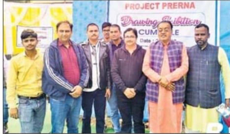
वेदांत इलेक्ट्रो स्टील के कला प्रदर्शनी में मौजूद अतिथि

ई एस एल स्टील लिमिटेड की इस शैक्षिक पहल में नामांकित छात्रों के अलावा, एम जी एम हाई स्कूल, बिजुलिया हाई स्कूल और चंदनक्यारी हाई स्कूल के छात्रों ने भी भाग लिया। इस सफल आयोजन में बच्चों ने मौज मस्ती की और साथ में उनके कलात्मक