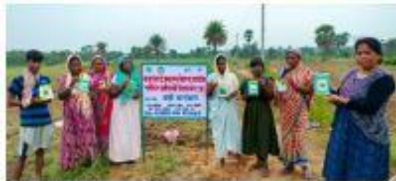
कौशलान्त साइब डैस्क, Koylanchal Live News. Team

BUKANGH : देशों और भारत की अग्रणी एकीकृत इस्पात उत्पादक ईएसएल स्टील लिमिटेड ने सामाजिक और सामुदायिक विकास के प्रति प्रतिबद्ध है. विभिन्न राष्ट्रीय और अंतर्राष्ट्रीय सामग्री निर्यातों और गैर सरकारी संगठनों से नई पुरस्कारों और सम्मानों से सम्बन्धित, ईएसएल स्टील लिमिटेड समाज के सभी वर्गों के उत्थान को प्राथमिकता देता है. अपनी सामुदायिक जिम्मेदारियों का निर्वहण करते हुए ईएसएल स्टील लिमिटेड ने प्रोसेसिंग वाटियों को नगरों के सर्वांग से और ग्रामीण सेवा सेवा के माध्यम से राष्ट्रीय किसान दिवस के अवसर पर एक सत्र का आयोजन किया. जहां अदिवासी किसानों को विभिन्न लाभ के बारे में जानकारी दी गई.