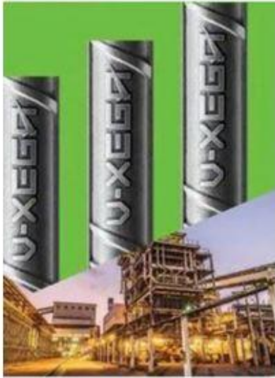
कोयचल स्टील ग्रुप: Koyanchal Live News

Coimbatore : वेदांता समूह की प्रमुख कंपनी ईस्टस्टील स्टील लिमिटेड ने उच्च गुणवत्ता वाले स्टील उत्पाद टीएमटी स्टील तांच के टीएमटी बार के साथ राष्ट्रीय स्तर पर खुदरा विक्री के क्षेत्र में कदम रखने की घोषणा की है, बिहार में टीएमटी स्टील तांच के साथ खुदरा विक्री शुरू की है। वित्तीय वर्ष 2024-25 तक नरसिंहराज तालीक में खुदरा विक्री का विस्तार अन्य राज्यों में भी किया जाएगा।